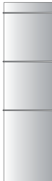
PLATT INOX 180 -... PLATT INOX 168 - 50